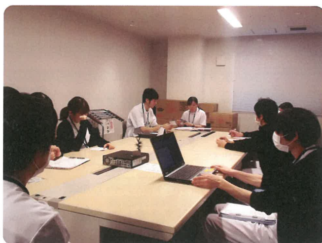
リハビリテーション・カンファレンス